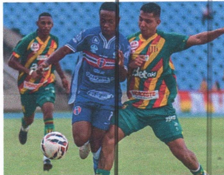
Após falta em jogador do MAC, volante Cavi recebe 3º cartão amarelo

A diferença do MAC para o TEC é de apenas um ponto, enquanto que o Sampaio tem 5 pontos a menos do Imperatriz, que por sua vez, tem dois a menos do líder Altos-PI, mas essa vantagem já foi maior. Restam quatro jogos. A