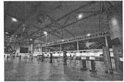
Assinatura do contrato de concessão de aeroporto ainda não ocorreu

Aeroporto Cunha Machado e Aeroporto de Imperatriz serão gerenciados pelo Grupo CCR