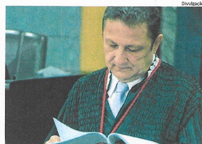
Desembargador Cleones Carvalho Cunha divulgou relatório ontem

■ BR-040/DF/GO/MG - entre Brasília e Juiz de Fora (MG), com 674,4 km. Atualmente concedida, a relicitação da rodovia pretende garantir a continuidade dos serviços operacionais e obras de recuperação, manutenção, monitoração, ampliação de capacidade e melhorias no trecho.